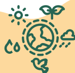
生態系統多樣性 Ecosystem diversity