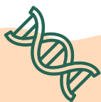
基因多樣性 Genetic diversity